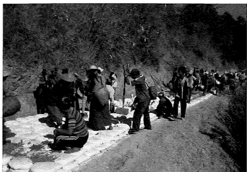
写真1 自助努力の似合うミャンマーの田舎でも道を直している

開発途上国の課題の解決を目指すため、2010(平成22)年8月にBOPビジネス連携促進としてJICA協力準備調査が初めて公示された。道普