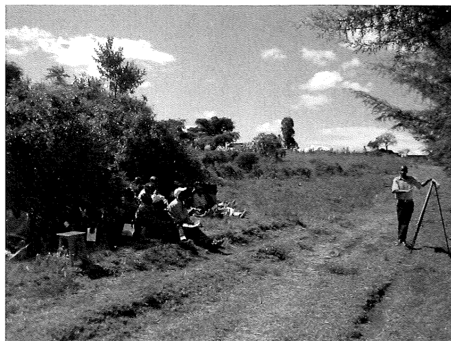
写真2 青空の下で次の発展に向けた農民研修

たとえばケニアにおいては、道直しの研修を受けた農業・若者グループがいくつか集まり「道直しアソシエーション」を組織化し、その代表が政府から土のう袋代、土代、トラック代を請求する動きが出てきている。都市部の若者や帰還難民・兵士の失業対策や技術習得に利用される動きもある。写真2は道直しの研修をすでに何回か受けた農民に、現地NPO職員が「道直しのお金を見積もれる、プロポーザルを書く」「能力を養うための研修を青空の下で行っている姿である。単に「道直し」といってほしいから、「どの部分の道を何日間ですら直したい」という要求に変化させる、非常に重要な研修である。 役人のトップダウンに関しては、新